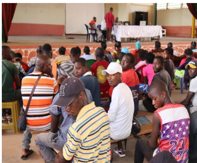
Identification des jeunes à Guéckédou