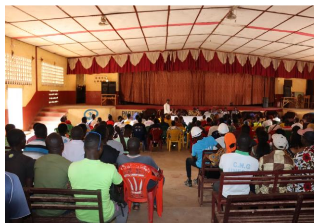
Identification des jeunes à Kissidougou