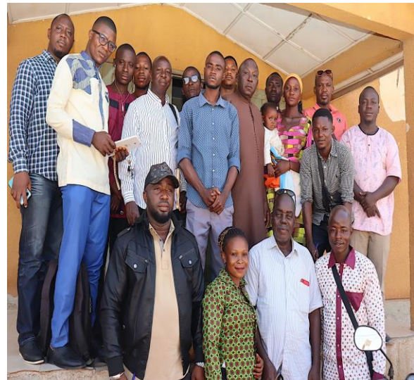
Enquête des PME's à N'Zérékoré

Sur un échantillon de 167 PME's de jeunes enquêtées dans ces cinq régions, ont créé au total 633 emplois dont 270 emplois durables.