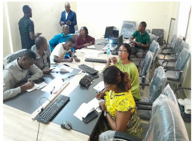
Formation des travailleurs dans la salle de réunion de l'AGETIPE