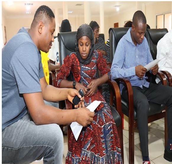
Enquête des PME's à Mamou

Quant à la notion de durabilité de l'intervention, les PME's possèdent des compétences qui leur permettront de former à leur tour les membres de leur équipe sans l'intervention de l'AGETIPE et peuvent obtenir et exécuter des contrats en utilisant les notions acquises lors de la formation.