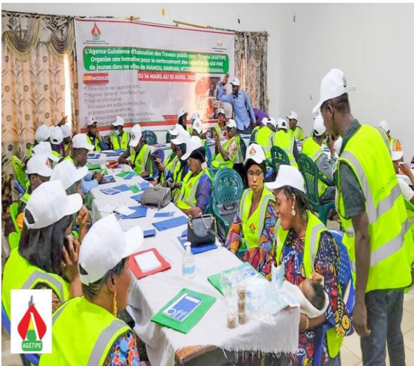
Formation à Mamou