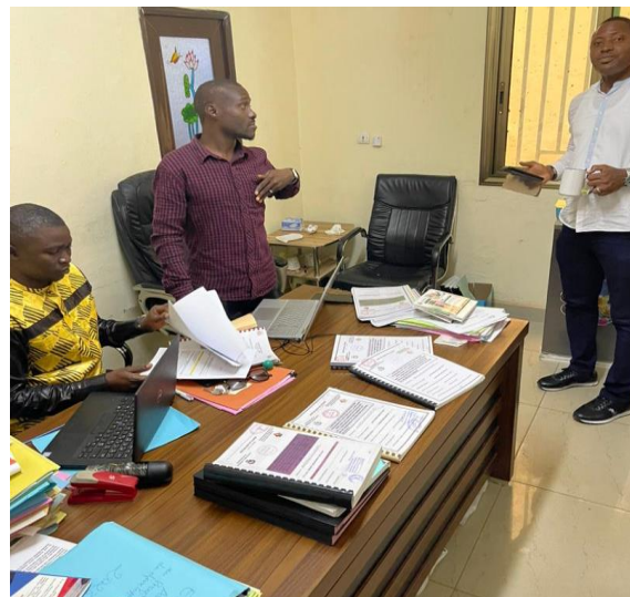
Copies des contrats du programme de Pavage