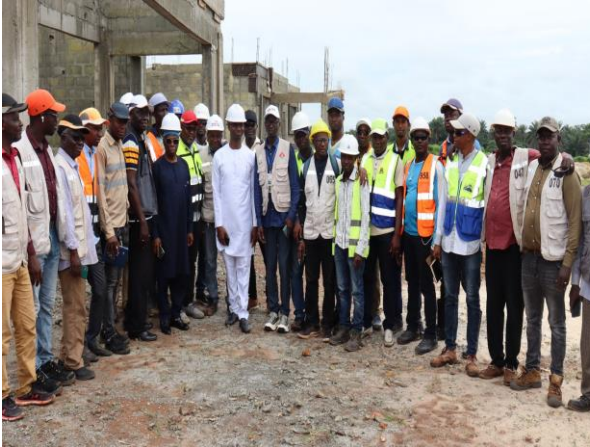
Formation à Boké