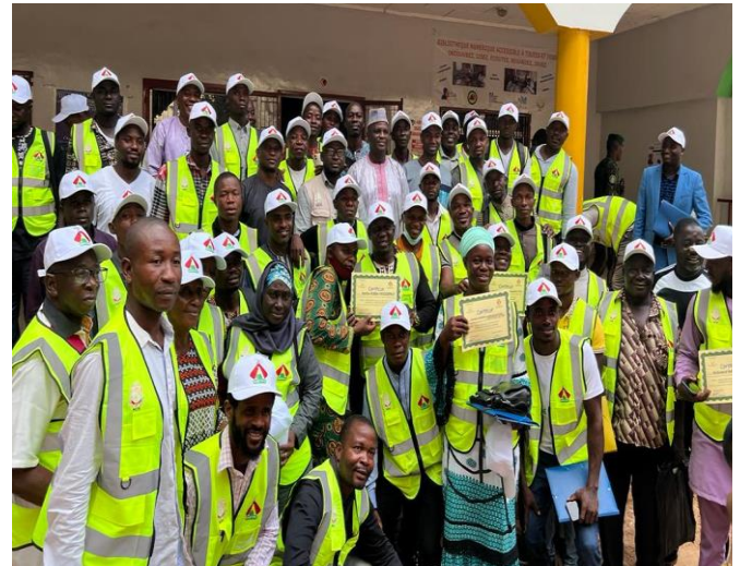
Formation à N'Zérékoré

Dix mois après la fin de cette activité de renforcement, une mission dirigée par le Chef de Département Planification, Suivi-Evaluation de l'AGETIPE s'est rendu dans les régions de Boké, Mamou, Faranah, N'Zérékoré et Kankan pour évaluer les effets de l'intervention sur les PME de jeunes formées.