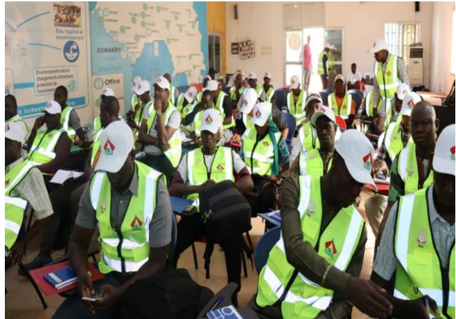
Formation à Kankan