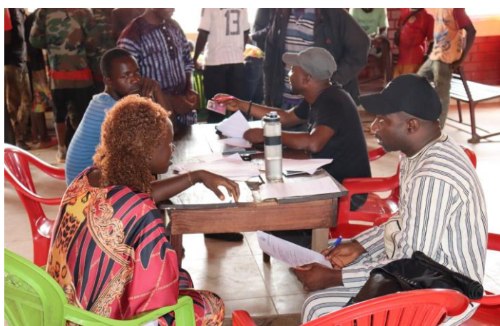
Identification des jeunes à Faranah