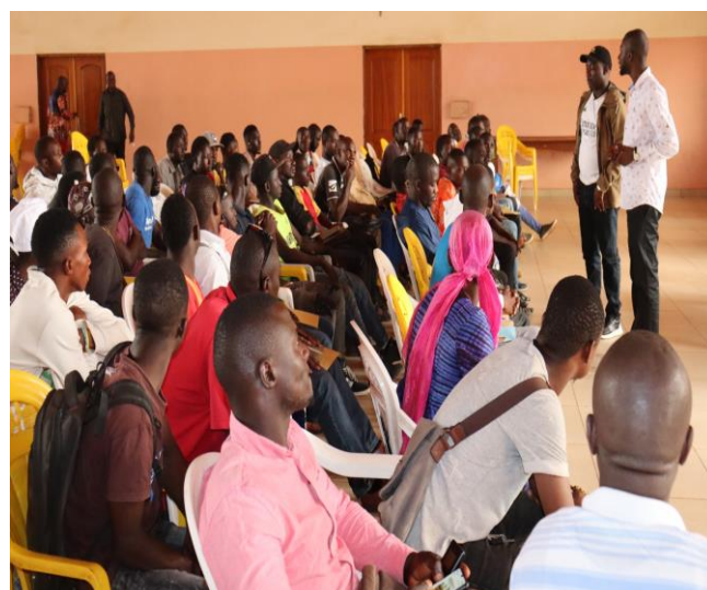
Identification des jeunes à Kankan